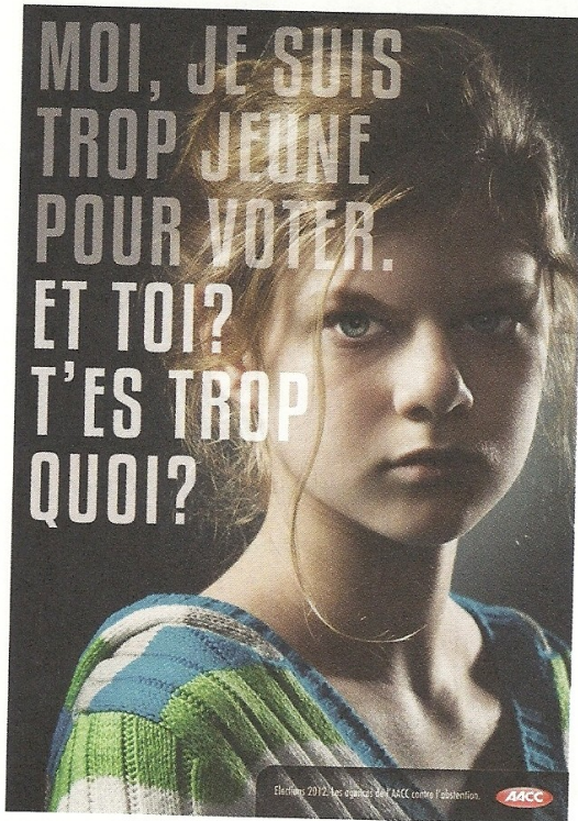
Affiche de l'agence de communication Herezie pour une campagne collective de l'Association des agences – conseils en communication, pour lutter contre l'abstention aux élections, 2012.