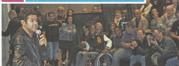
Le 9 novembre 2011, à Clichy-sous-Bois, des artistes comme Jamel Debbouze ont incité les jeunes à s'inscrire sur les listes électorales et « être acteur » de leur futur.